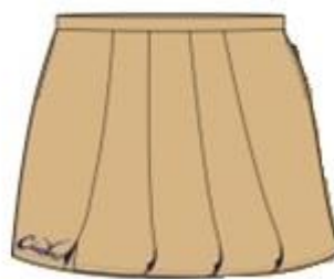
有摺裙褲 (小三至小六 女生適用)